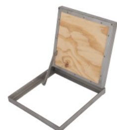
Lieferung ohne Befüllung